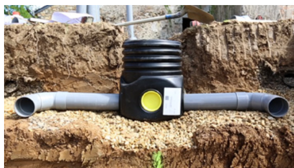
Pose facilitée grâce aux rehausses télescopiques