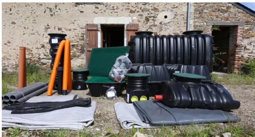
Kit livré complet, prêt à poser