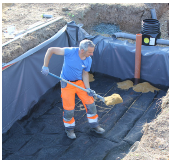
Faible empreinte au sol : 11 m 2 pour le filtre compact 6 EH, 22 m 2 pour le 12 EH