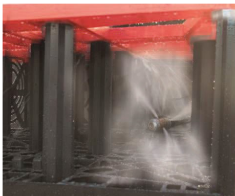
Płukanie ciśnieniowe systemu

Regularne sprawdzanie systemu rozsączania/retencji zapewni wysoką wydajność i zagwarantuje szybkie rozprrowadzenie wody powierzchniowej i deszczowej w przypadku silnych opadów o dużej intensywności.