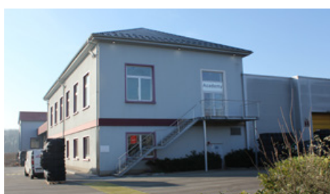
GRAF (67) - Batiment H6 - 2023