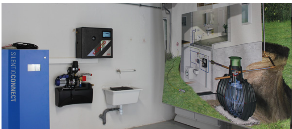
GRAF Academy - Atelier de formation - 2023