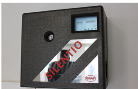
GRAF Academy - Atelier de formation - 2023

Chaque session est adaptée en fonction des connaissances de chacun.