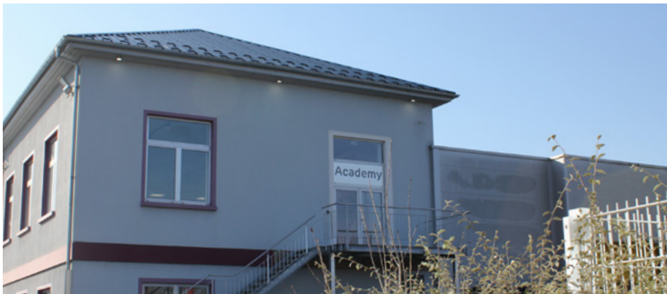
GRAF Academy - 2023

GRAF France, leader européen sur le marché de la gestion des eaux pluviales, lance son tout nouvel espace de formation de 500 m 2 à partir de début février.