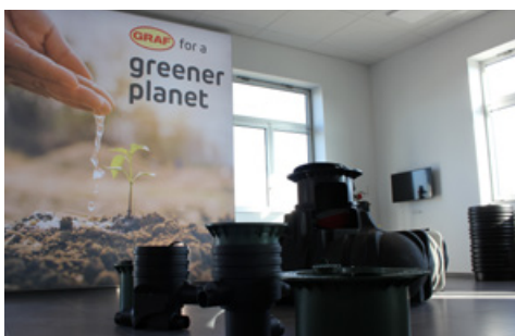
GRAF (67) - Showroom - Espace récupération eau de pluie

Le showroom est également équipé d'une salle de meeting. Dotée de baies vitrées, elle permet de garder une vue d'ensemble sur le showroom et ainsi d'illustrer les présentations.