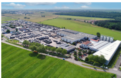
GRAF - Site de Dachstein - 2021