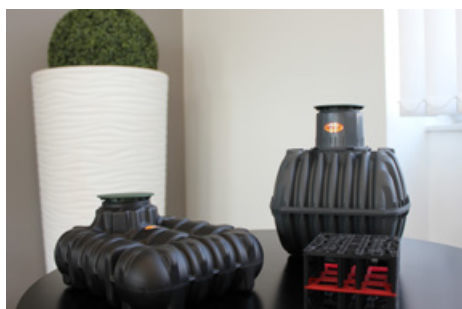
GRAF Academy - Showroom - 2023