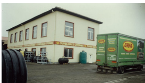
GRAF (67) - Batiment H6 - 1981

Pour cela, plusieurs ateliers sont proposés : une partie théorique au showroom, une mise en pratique dans l'atelier et une visite d'usine.