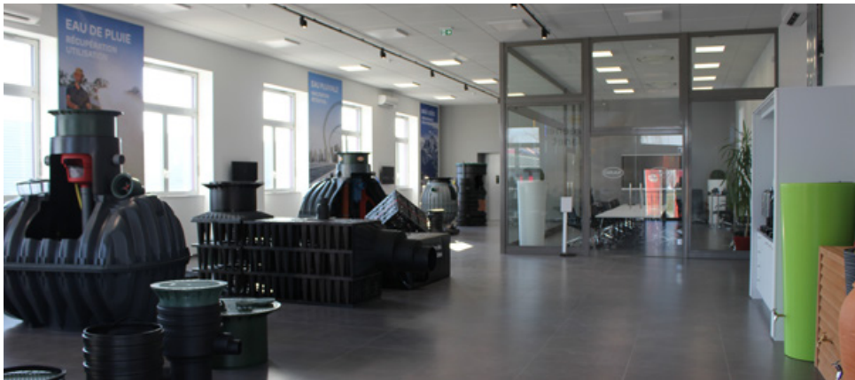
GRAF Academy - Showroom - 2023