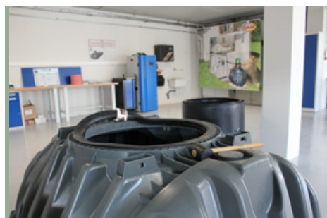
GRAF Academy - Atelier de formation - 2023