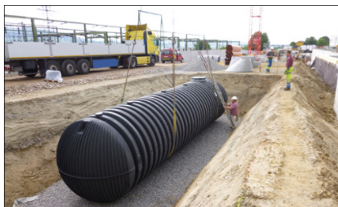
Grâce aux sangles de levage incluses dans la livraison, la cuve a été directement installée dans la fosse grâce à une seule grue mobile.