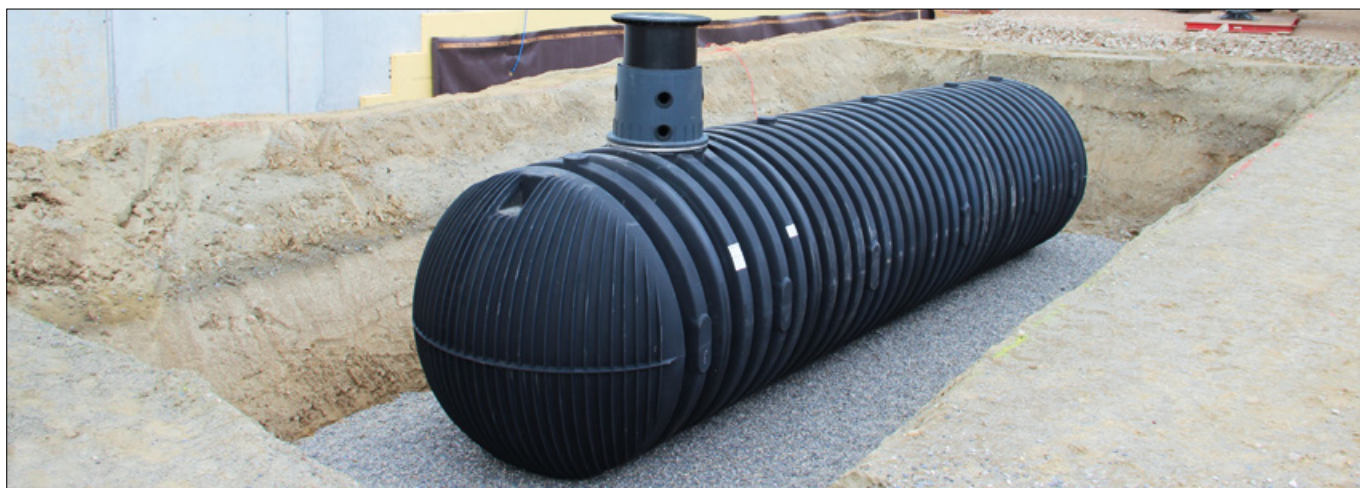
Le procédé de fabrication de la cuve lui assure une stabilité exceptionnelle et permet une installation dans la nappe phréatique jusqu'à l'équateur de la cuve. La cuve Carat XXL support un passage camions jusqu'à 40 tonnes.