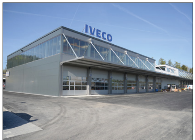
22 stations de nettoyage et de réparation sont prévues sur le nouveau site d'Iveco à Hendschiken.