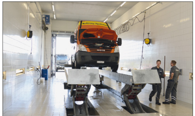
875 000 litres d'eau potable utilisés pour nettoyer les véhicules et alimenter les toilettes sont économisés chaque année.

Le procédé de fabrication lui assure une stabilité exceptionnelle et permet l'installation dans la nappe phréatique jusqu'à l'équateur de la cuve. Équipée d'une rehausse prévue à cet effet, la cuve Carat XXL supporte un passage camions jusqu'à 40 tonnes. Au besoin la cuve peut-être équipée d'un second dôme permettant un accès supplémentaire. La cuve est équipée en standard de raccords allant jusqu'au DN 200, des raccords de diamètre supérieur étant disponibles sur demande. Preuve de la qualité de la cuve Carat XXL, GRAF offre une garantie de 25 ans sur son produit.